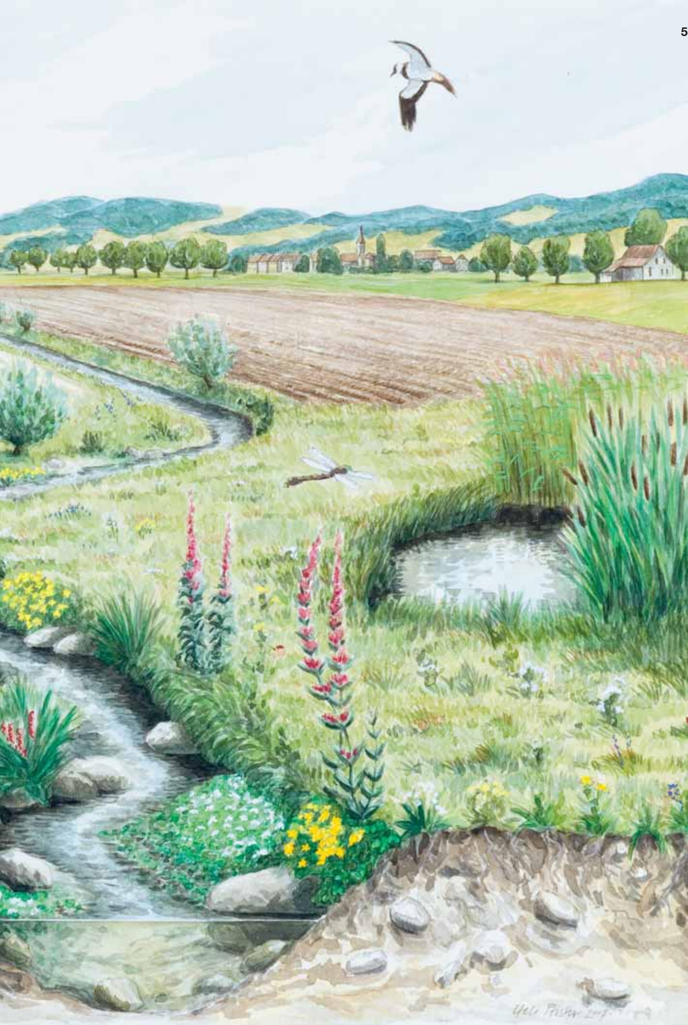
Illustration: Schmutz & Pfister