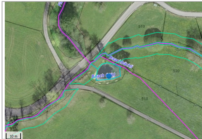
Kantonales Gewässernetz 1996, Kommunale Naturschutzzone (Überlagern / Grundnutzung), Inventar der kantonal geschützten Naturobjekte Plangrundlagen: GIS-Fachstelle BL