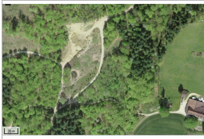
Kantonales Gewässernetz 1996 Kommunale Naturschutzzone (Überlagern / Grundnutzung) Inventar der kantonal geschützten Naturobjekte Plangrundlagen: GIS-Fachstelle BL