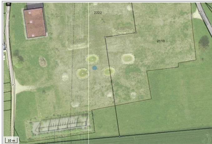
Kantonales Gewässernetz Kommunale Naturschutzzone (Überlagernd / Grundnutzung) Inventar der kantonal geschützten Naturobjekte Plangrundlagen: GIS-Fachstelle BL