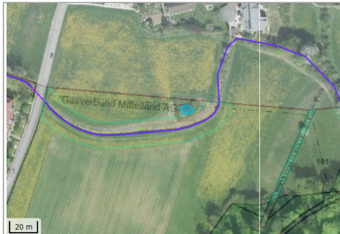
Kantonales Gewässernetz Kommunale Naturschutzzone (Überlagernd / Grundnutzung) Inventar der kantonal geschützten Naturobjekte Plangrundlagen: GIS-Fachstelle BL