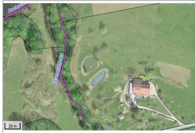
Kantonales Gewässernetz Kommunale Naturschutzzone (Überlagernd / Grundnutzung) Inventar der kantonal geschützten Naturobjekte Plangrundlagen: GIS-Fachstelle BL