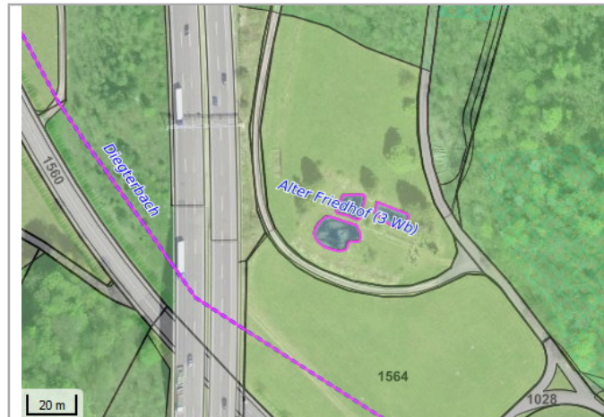
Kantonales Gewässernetz Kommunale Naturschutzzone (Überlagernd / Grundnutzung) Inventar der kantonal geschützten Naturobjekte Plangrundlagen: GIS-Fachstelle BL