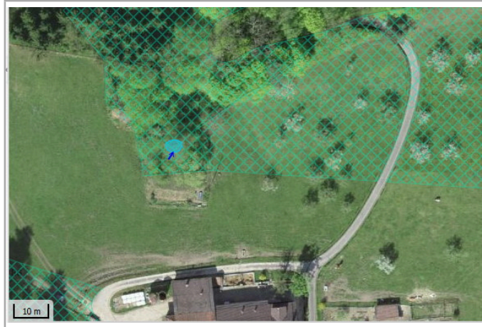
Kantonales Gewässernetz 1996 Kommunale Naturschutzzone (Überlagern / Grundnutzung) Inventar der kantonal geschützten Naturobjekte Plangrundlagen: GIS-Fachstelle BL