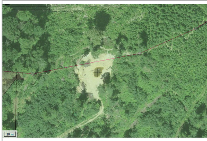
Kantonales Gewässernetz 1996, Kommunale Naturschutzzone (Überlagernd / Grundnutzung), Inventar der kantonal geschützten Naturobjekte Plangrundlagen: GIS-Fachstelle BL