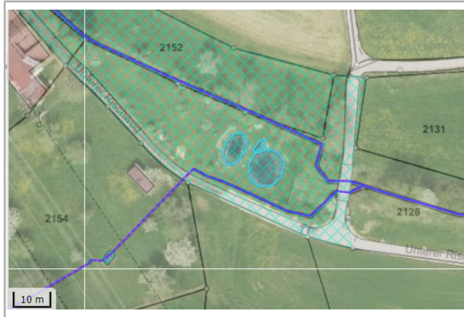
Kantonales Gewässernetz 1996, Kommunale Naturschutzzone (Überlagernd / Grundnutzung), Inventar der kantonal geschützten Naturobjekte Plangrundlagen: GIS-Fachstelle BL