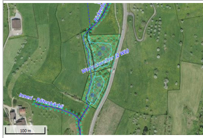
Kantonales Gewässernetz 1996, Kommunale Naturschutzzone (Überlagernd / Grundnutzung), Inventar der kantonal geschützten Naturobjekte Plangrundlagen: GIS-Fachstelle BL