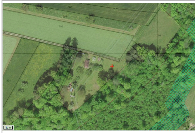
Kantonales Gewässernetz 1996 Kommunale Naturschutzzone (Überlagernd / Grundnutzung) Inventar der kantonal geschützten Naturobjekte Plangrundlagen: GIS-Fachstelle BL