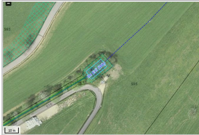
Kantonales Gewässernetz, Kommunale Naturschutzzone (Überlagern / Grundnutzung), Inventar der kantonal geschützten Naturobjekte Plangrundlagen: GIS-Fachstelle BL