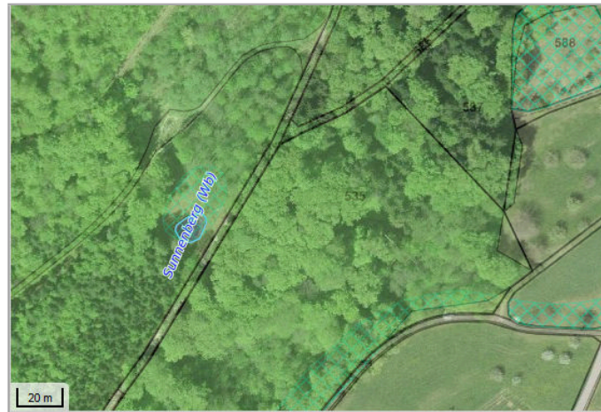
Kantonales Gewässernetz 1996 Kommunale Naturschutzzone (Überlagern / Grundnutzung) Inventar der kantonal geschützten Naturobjekte Plangrundlagen: GIS-Fachstelle BL