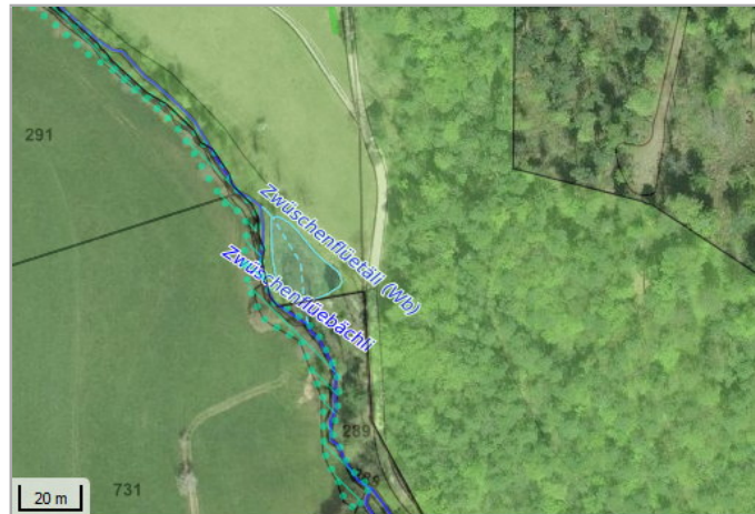
Kantonales Gewässernetz 1996 Kommunale Naturschutzzone (Überlagemd / Grundnutzung) Inventar der kantonal geschützten Naturobjekte Plangrundlagen: GIS-Fachstelle BL