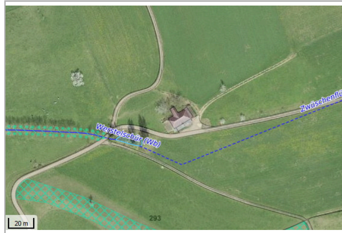
Kantonales Gewässernetz 1996, Kommunale Naturschutzzone (Überlagernd / Grundnutzung), Inventar der kantonal geschützten Naturobjekte Plangrundlagen: GIS-Fachstelle BL