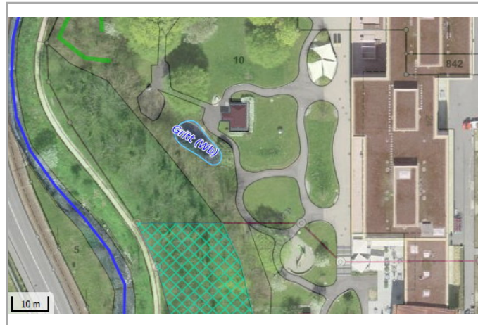
Kantonales Gewässernetz 1996 Kommunale Naturschutzzone (Überlagern / Grundnutzung) Inventar der kantonal geschützten Naturobjekte Plangrundlagen: GIS-Fachstelle BL