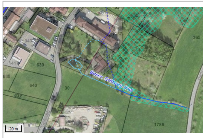
Kantonales Gewässernetz Kommunale Naturschutzzone (Überlagern / Grundnutzung) Inventar der kantonal geschützten Naturobjekte Plangrundlagen: GIS-Fachstelle BL