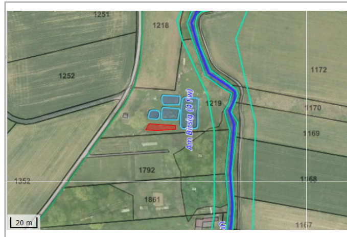
Kantonales Gewässernetz 1996 Kommunale Naturschutzzone (Überlagernd / Grundnutzung) Inventar der kantonal geschützten Naturobjekte Plangrundlagen: GIS-Fachstelle BL