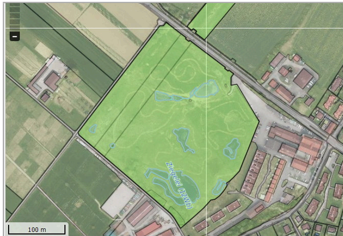
Kantonales Gewässernetz 1996 Kommunale Naturschutzzone (Überlagernd / Grundnutzung) Inventar der kantonal geschützten Naturobjekte Plangrundlagen: GIS-Fachstelle BL