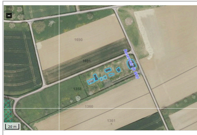
Kantonales Gewässernetz Kommunale Naturschutzzone (Überlagern / Grundnutzung) Inventar der kantonal geschützten Naturobjekte Plangrundlagen: GIS-Fachstelle BL