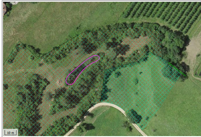
Kantonales Gewässernetz 1996 Kommunale Naturschutzzone (Überlagern / Grundnutzung) Inventar der kantonal geschützten Naturobjekte Plangrundlagen: GIS-Fachstelle BL