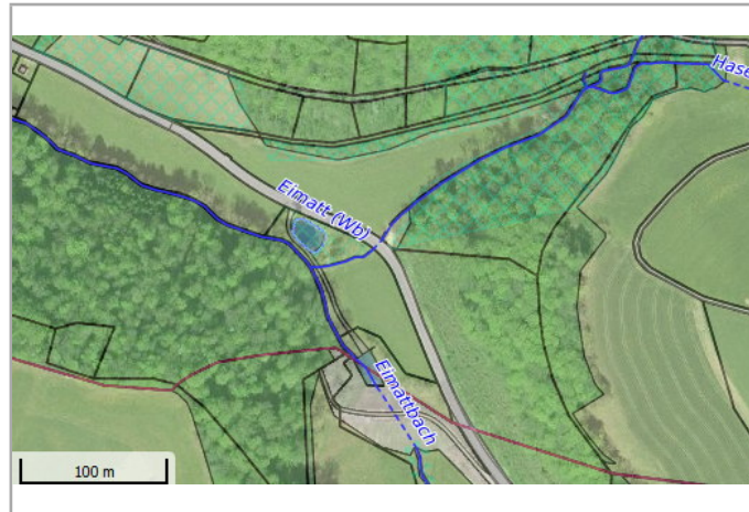
Kantonales Gewässernetz 1996 Kommunale Naturschutzzone (Überlagernd / Grundnutzung) Inventar der kantonal geschützten Naturobjekte Plangrundlagen: GIS-Fachstelle BL