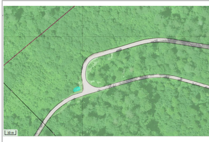
Kantonales Gewässernetz 1996 Kommunale Naturschutzzone (Überlagernd / Grundnutzung) Inventar der kantonal geschützten Naturobjekte Plangrundlagen: GIS-Fachstelle BL