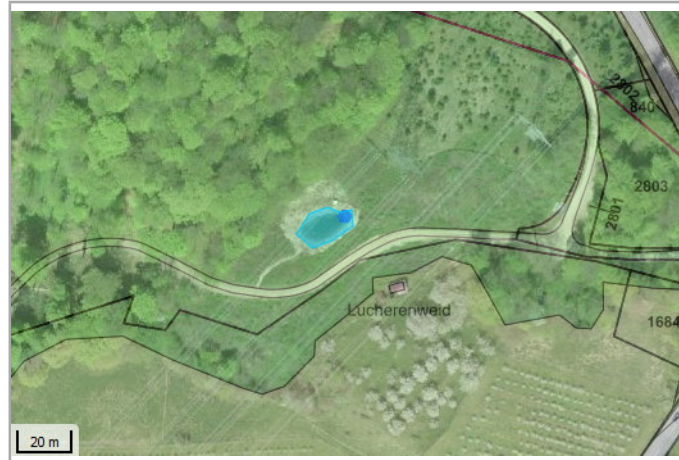
Kantonales Gewässernetz 1996, Kommunale Naturschutzzone (Überlagernd / Grundnutzung), Inventar der kantonal geschützten Naturobjekte Plangrundlagen: GIS-Fachstelle BL