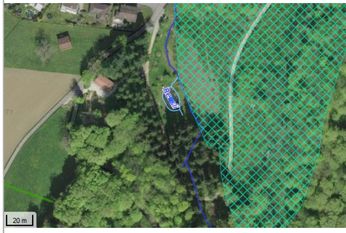
Kantonales Gewässernetz 1996, Kommunale Naturschutzzone (Überlagern / Grundnutzung), Inventar der kantonal geschützten Naturobjekte Plangrundlagen: GIS-Fachstelle BL