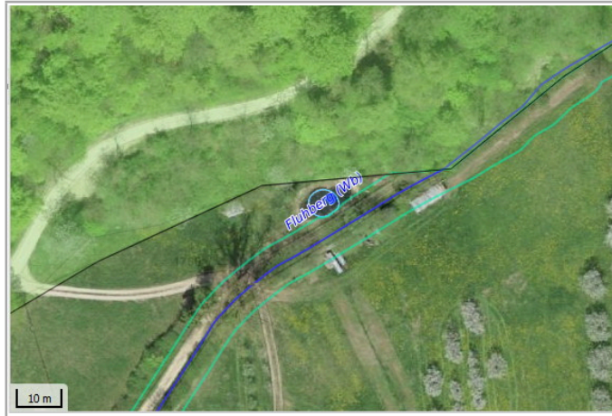
Kantonales Gewässernetz 1996, Kommunale Naturschutzzone (Überlagernd / Grundnutzung), Inventar der kantonal geschützten Naturobjekte Plangrundlagen: GIS-Fachstelle BL