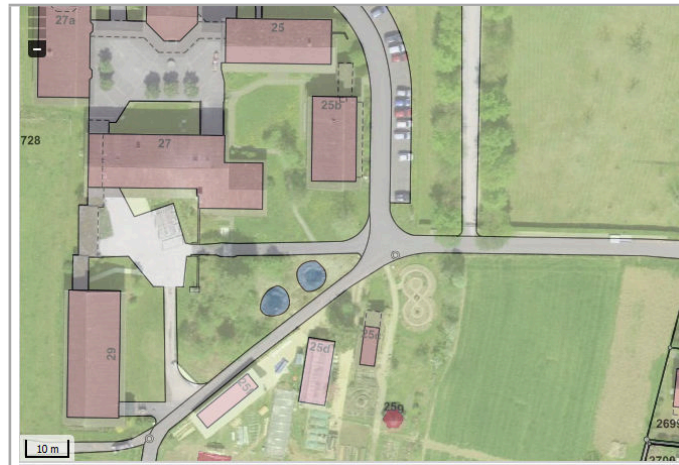
Kantonales Gewässernetz Kommunale Naturschutzzone (Überlagernd / Grundnutzung) Inventar der kantonal geschützten Naturobjekte Plangrundlagen: GIS-Fachstelle BL