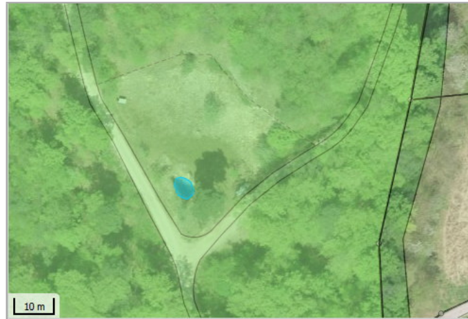
Kantonales Gewässernetz 1996, Kommunale Naturschutzzone (Überlagern / Grundnutzung), Inventar der kantonal geschützten Naturobjekte Plangrundlagen: GIS-Fachstelle BL