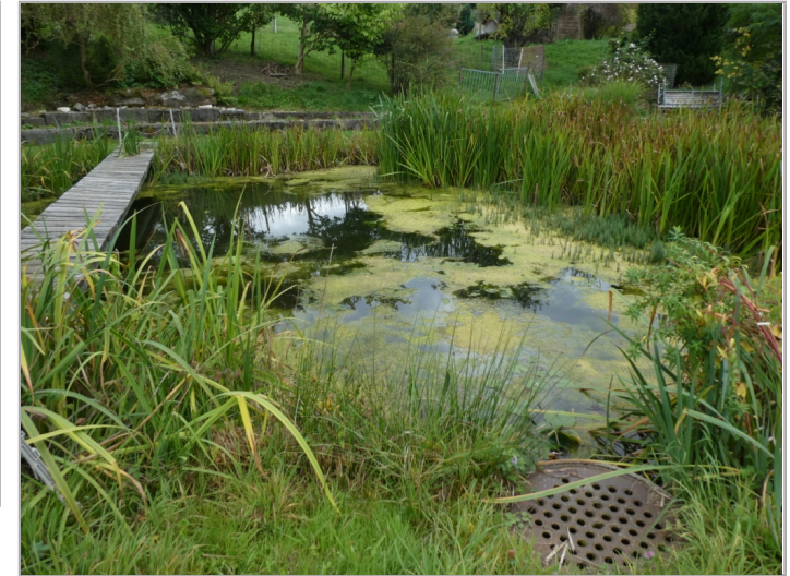
Kantonales Gewässernetz Kommunale Naturschutzzone (Überlagernd / Grundnutzung) Inventar der kantonal geschützten Naturobjekte