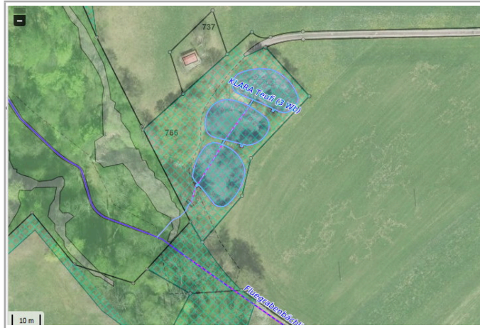
Kantonales Gewässernetz Kommunale Naturschutzzone (Überlagernd / Grundnutzung) Inventar der kantonal geschützten Naturobjekte Plangrundlagen: GIS-Fachstelle BL