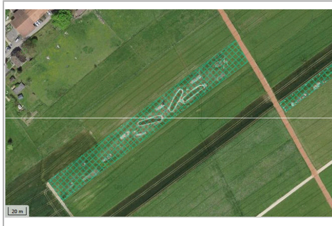
Kantonales Gewässernetz 1996, Kommunale Naturschutzzone (Überlagernd / Grundnutzung), Inventar der kantonal geschützten Naturobjekte Plangrundlagen: GIS-Fachstelle BL