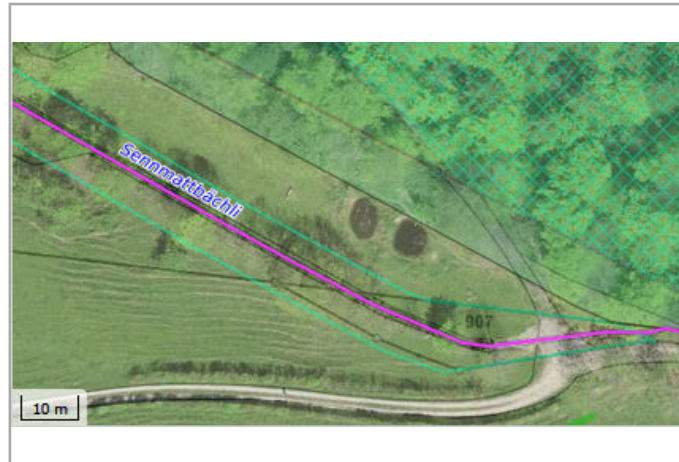
Kantonales Gewässernetz 1996 Kommunale Naturschutzzone (Überlagernd / Grundnutzung) Inventar der kantonal geschützten Naturobjekte Plangrundlagen: GIS-Fachstelle BL