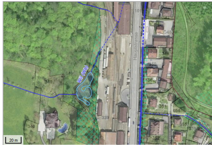
Kantonales Gewässernetz Kommunale Naturschutzzone (Überlagern / Grundnutzung) Inventar der kantonal geschützten Naturobjekte Plangrundlagen: GIS-Fachstelle BL