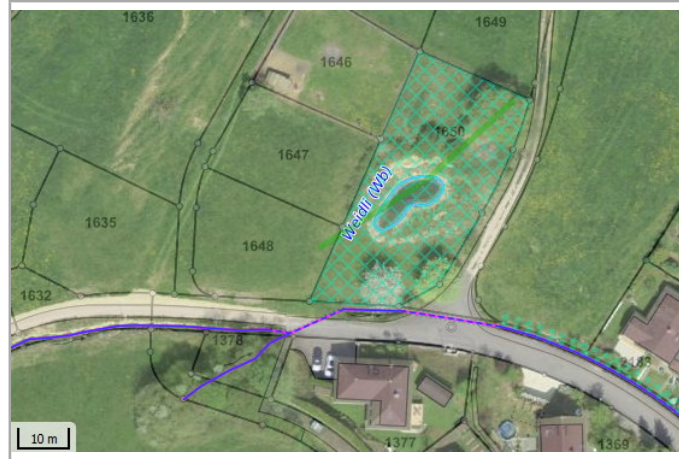
Kantonales Gewässernetz Kommunale Naturschutzzone (Überlagernd / Grundnutzung) Inventar der kantonal geschützten Naturobjekte Plangrundlagen: GIS-Fachstelle BL